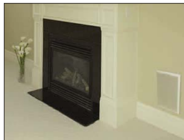
SUBWOOFER «IN-WALL» AVEC GRILLE