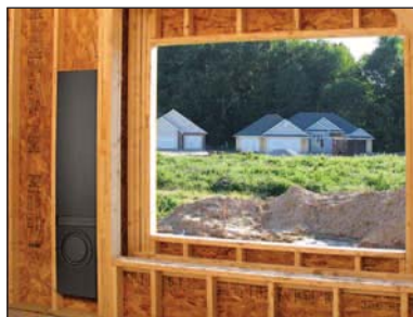
S'INSTALLE ENTRE MONTANTS À ESPACEMENT STANDARD

VOIR FICHE TECHNIQUE POUR PLUS DE DÉTAILS.