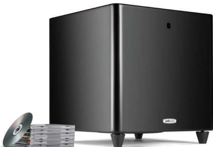
DSW PRO 500