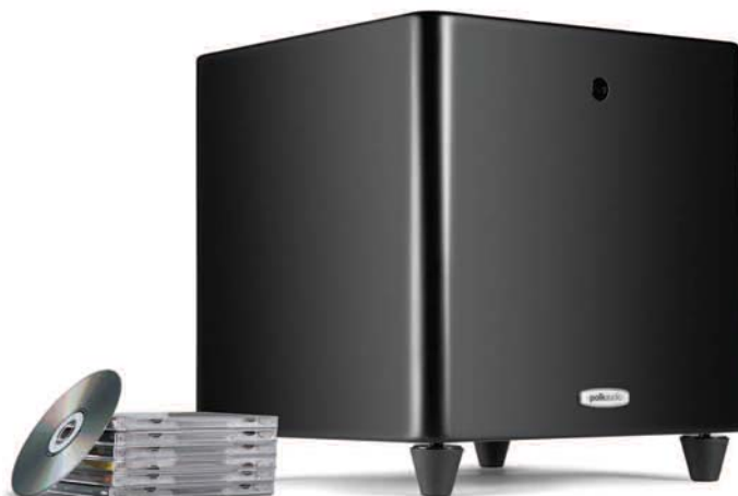
DSW PRO 400