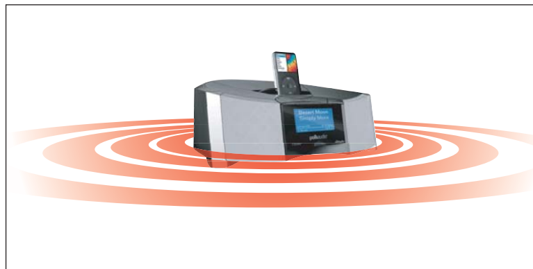
CONFIGURACIÓN DE 4 ALTAVOCES DEL I-SONIC ES2