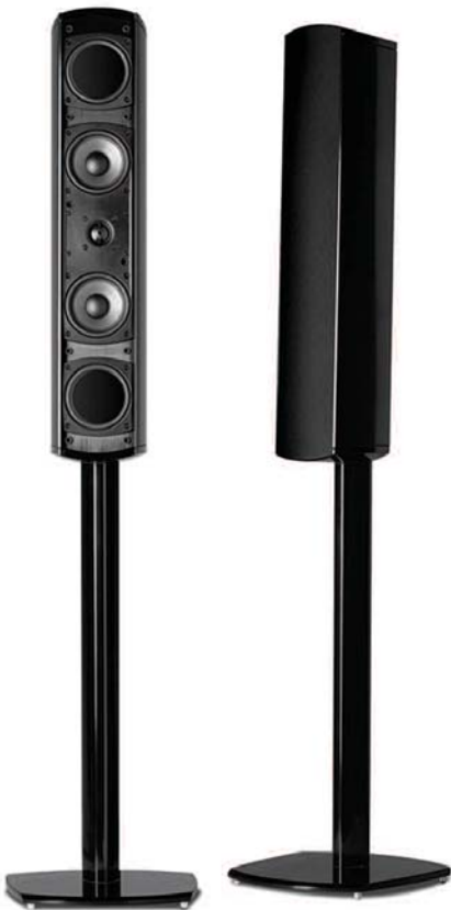
VM20 (PEDESTAL DE PISO OPCIONAL)