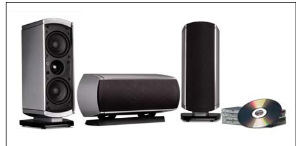
VM10 (APARECE COMO ALTAVOZ IZQUIERDO, CENTRAL Y DERECHO)